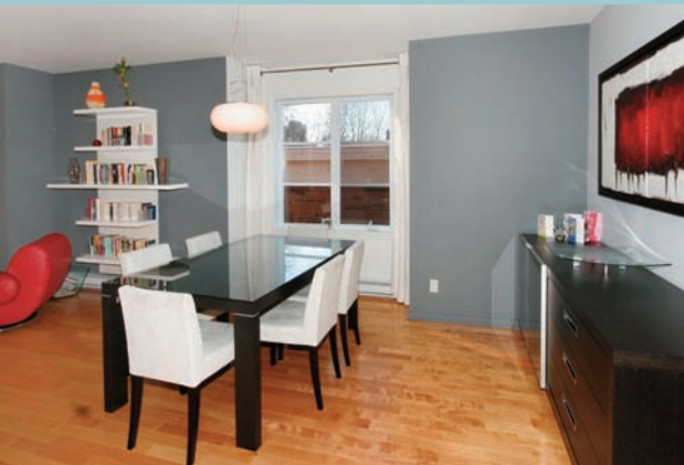
SALON, SALLE À MANGER